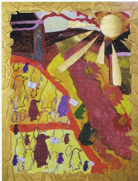
To af værkerne fra det præmierede billedkunstprojekt 'Andre Landskaber' fra 9. klasse på Holbergskolen.